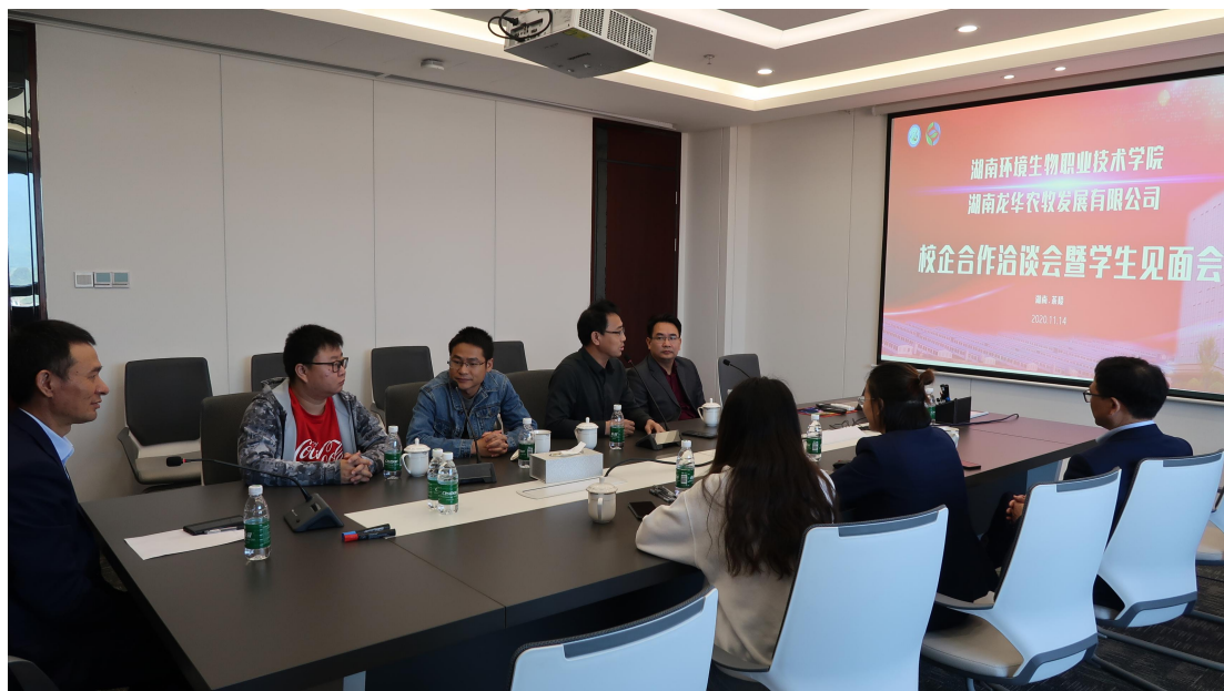
图 4-3 与湖南环境生物职业技术学院校企合作洽谈会暨学生见面会

职业技术学院的学生全部安排集体生活，在工作闲暇之余能相互为伴。保障了学生的共同成长并感受到集体的温暖。