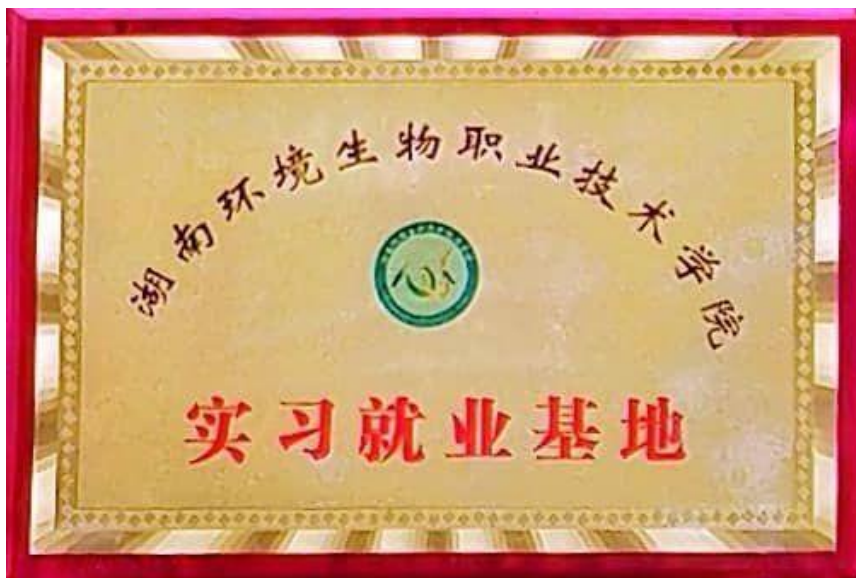
图 4-2 湖南环境生物职业技术学院实习就业基地牌匾